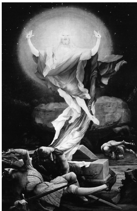
Abb. 3. Matthias Grünewald, Die Auferstehung , Isenheimer Altar (1512–1516) [Ausschnitt], Tempera und Öl auf Lindenholz, 292 x 167 cm (Musée Unterlinden, Colmar).

grafische Phänomene verweist, lässt sich mit Blick auf zwei historische Kontexte seiner Begriffsfindung noch näher entfalten. So schließt das Verständnis von Aura als atmosphärischer Lichterscheinung – ihre Bestimmung als »an elusive phenomenal substance, ether, or halo that surrounds a person or object of perception« 7 – auch an eine ikonographische Tradition vor allem der christlichen Malerei an, in der sich die Köpfe oder Körper der Heiligen mit entsprechenden Leuchteffekten spirituellen Ursprungs ausgestattet finden. Zu den prominentesten Formen dieser Darstellungstradition zählt die so genannte Aureole, eine spezifische Art von Nimbus, die (beinahe) den gesamten Leib der abgebildeten Figur umschließt – wobei es am häufigsten, wie etwa auf Matthias Grünewalds Isenheimer Altar , der Leib Christi selbst ist, der auf diese Weise ausgezeichnet wird (Abb. 3).