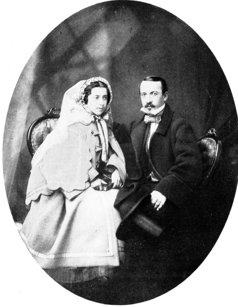
Abb. 7. Karl Dauthendey, Selbstporträt mit seiner Braut, Fräulein Friedrich nach dem ersten gemeinsamen Kirchgang am 1. September 1857 , aus Aus der Frühzeit der Photographie 1840–70 , hg. v. Helmuth Th. Bossert u. Heinrich Guttman (Frankfurt a.M.: Societäts-Verlag, 1930), Tafel 128.

In Benjamins Perspektive stellt sich der Vorausblick der Frau auf das Ereignis ihres Suizids als Komplement jenes Rückblickes dar, den der Betrachter auf die im Bild festgehaltene Tote richtet, wobei die Fotografie als vermittelnde Schwelle zwischen Leben und Tod wirksam bzw. erkennbar wird. So gesehen ist der »magisch[e] Wert« (ebd.), den Benjamin der Aufnahme zuschreibt, nicht zuletzt als ein Ausdruck der Tatsache zu verstehen, dass sie sich in gewissem Sinne selbst als Geist der auf ihr abgebildeten Personen darstellt. Nicht von ungefähr lässt etwa auch die Kopfbekleidung von Dauthendey's Braut an jene schleierartigen Phänomene denken, wie sie nahezu zeitgleich auf den frühesten Geisterfotografien in Erscheinung zu treten beginnen, so zum Beispiel auf einer von William Mumler erstellten Aufnahme aus dem Jahr 1869, die den Börsenmakler Charles Livermore mit dem Geist seiner verstorbenen Frau zu zeigen vorgibt (Abb. 8). 21