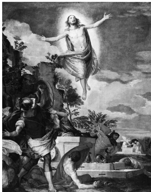
Abb. 9. Paolo Veronese, ( Die Auferstehung Christi ) (ca. 1570), Öl auf Leinwand, 136 x 104 cm (Staatliche Kunstsammlungen Dresden).

der Frau) ab, sondern zugleich und in eins damit die Möglichkeit einer geisterhaften Vivifikation; und die Belehnung der Fotografie mit dieser zweiten, gleichsam pneumatischen Qualität indiziert, dass Benjamins Überlegungen hier auch mit jener techno-spiritualistischen Praxis des späten 19. Jahrhunderts korrespondieren, in deren Kontext die Toten (wieder) ins Bild gesetzt wurden, um die noch Lebenden in Gestalt aureolen- und lichthofartiger Gebilde einzuhüllen.