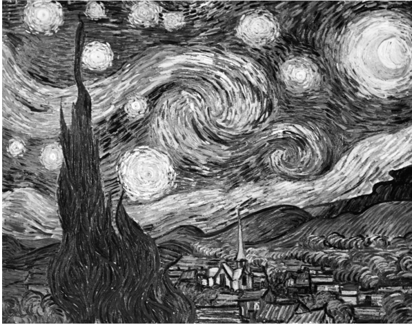
Abb. 2. Vincent van Gogh, De sterrennacht (1889), Öl auf Leinwand, 73.7 x 92.1 cm (Museum of Modern Art, New York).

Dieses Werk zeigt das südfranzösische Dorf Saint-Remy unter einem Firmament, in dem sich »alle Dinge« – sprich: jeder einzelne der dargestellten Himmelskörper – von einem ihm eigenen hellen Lichthof umgeben bzw. eingehüllt zeigt. Genau damit aber hilft das Gemälde zugleich zu erkennen, dass jener »richtige Begriff« der Aura, wie Benjamin ihn bei van Gogh auf paradigmatische Weise artikuliert sieht, von Beginn an auch ein bestimmtes Konzept des Mediums in sich einschließt . Was nämlich in Gestalt der von van Gogh gemalten Lichthöfe in gleichsam explizitester Form sichtbar (gemacht) wird, ist Aura in einem elementaren Sinne von Atmosphäre – ein Phänomen, wie es sich in einem physikalischen Medium sowie aufgrund der spezifischen Dichte dieses Mediums auszubilden vermag. 6 Präziser gefasst: Jene natürliche Erscheinung,